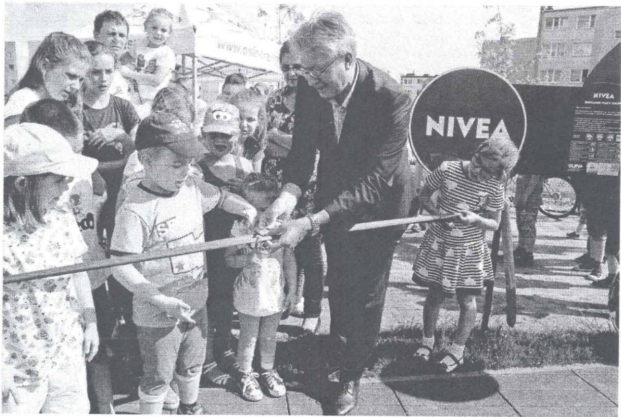
—Srem--_Zdjecia z otwarcia_NIVEA_P_2016 (8).jpg